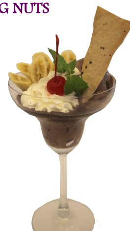
CHOC' O HOLIC

Приятного аппетита!, Bon Appétit, Enjoy your meal