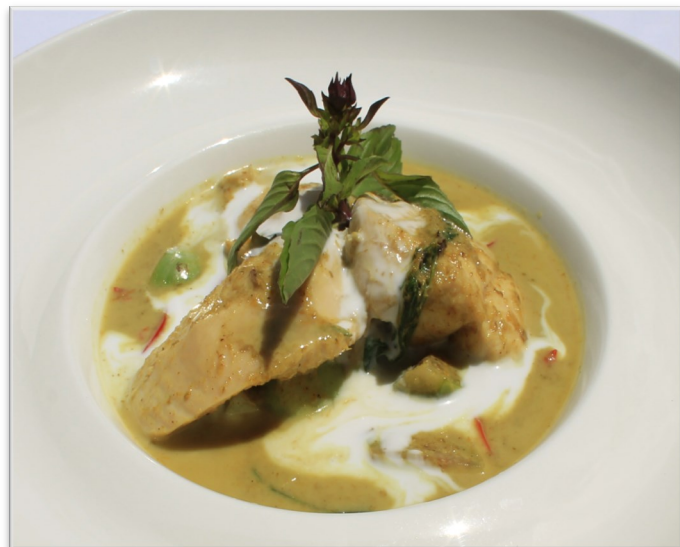
GAENG KIEW WAAN GAI