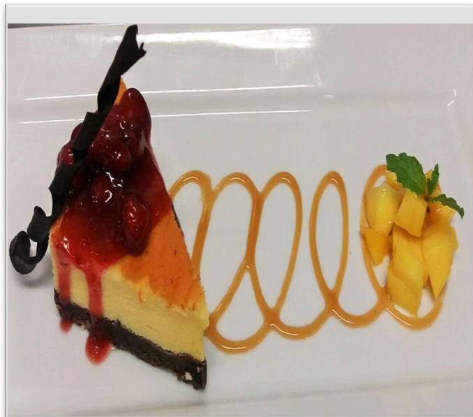
НЬЮ ЙОРКСКИЙ ЧИЗКЕЙК