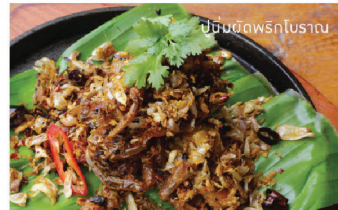
หมี่ผัดพริกโบราณ