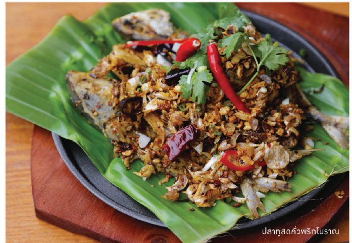
ปลาทอดคั่วพริกโบราณ