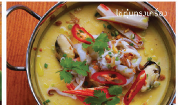
ปลากระพงทอดขมิ้น