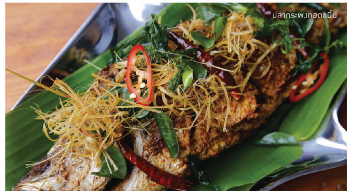
ขากรงกบผัดกระเพรากรอบ