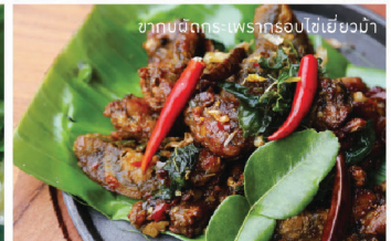
ปูนึ่งผัดพริกโบราณ