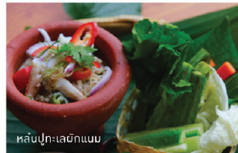
ไข่ตุ๋นทรงเครื่อง